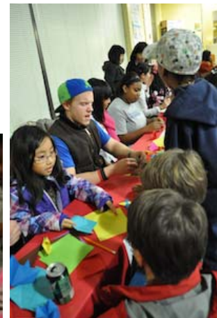
インターナショナル・カーニバル